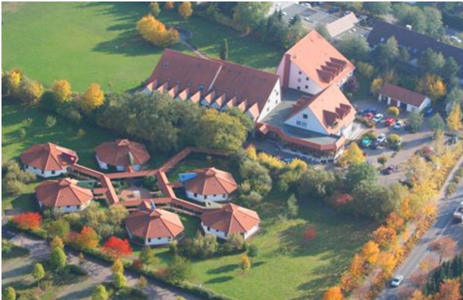
Das Jugendgästehaus in Duderstadt

Für Rückfragen stehen wir gerne zur Verfügung. Bitte dazu eine Mail an institutkim@web.de .